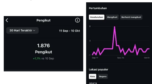
Gambar 5. Data dan grafik pengikut 11 Sep - 10 Okt 2024