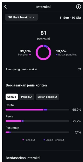
Gambar 6. Data interaksi 11 Sep - 10 Okt 2024

menggambarkan bahwasannya mayoritas interaksi yang terjadi berasal dari para audiens yang terhubung dengan akun @narada_cs.