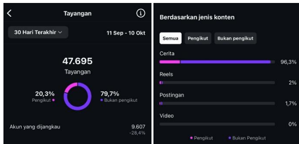
Gambar 4. Data dan grafik penayang 11 Sep - 10 Okt 2024