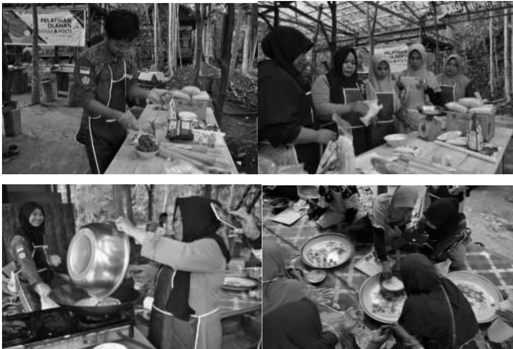
Gambar 6. Proses Pembuatan Olahan Nanas dan Hortikultura

Selanjutnya kegiatan pelatihan “Pengolahan Nanas dan Hortikultura” ( Gambar 6 ) bertujuan untuk memberikan pengetahuan kepada kelompok masyarakat dalam memanfaatkan SDA yang ada di sekitar mereka untuk selanjutnya dilakukan ke tahap pengembangan produk yang layak dipasarkan. Tujuan yang sama seperti kegiatan sebelumnya, namun dengan sumber daya yang berbeda pula. Berlimpahnya tanaman hortikultura yang menjadikan mayoritas masyarakat juga memiliki mata pencaharian sebagai petani hortikultura juga menjadikan suatu keuntungan dalam kegiatan pemberdayaan masyarakat ini.