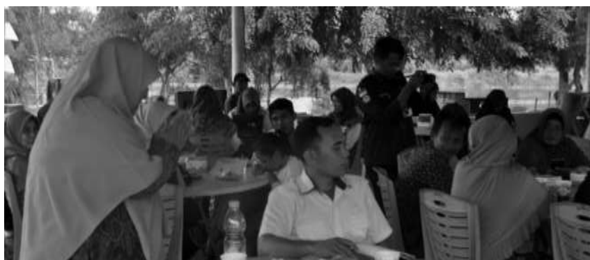
Gambar 3. Sesi Tanya Jawab Peserta kepada Pemateri

FGD dilaksanakan guna menampung permasalahan masyarakat secara langsung yang diawali dengan pemberian materi terlebih dahulu. FGD dilaksanakan dalam kurun waktu satu minggu dengan berbagai persiapan seperti lokasi, perlengkapan, konsumsi, dan registrasi peserta. Setelah dilakukannya diskusi dalam bentuk FGD ini, tim mengumpulkan masalah-masalah yang dihadapi masyarakat. Tidak jauh berbeda dengan diskusi awal bersama mitra BUMDes Mekar Jaya, masalah yang dihadapi ialah pada banyaknya limbah tanaman serai wangi dan limbah pasar yang terbuang serta kurangnya pemanfaatan lebih lanjut pada bahan mentah nanas dan kangkung yang menjadi sumber daya alam yang paling banyak dihasilkan. Masalah dikumpulkan melalui sesi tanya jawab peserta seperti yang terlihat pada Gambar 3 .