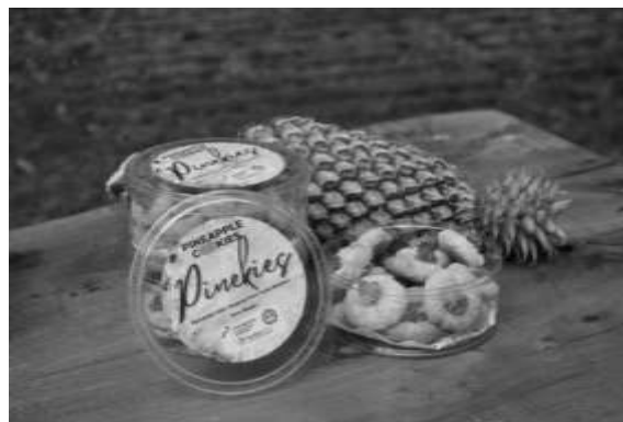
Gambar 9. Hasil Produk Olahan Nanas

Sedangkan produk yang dihasilkan dari kegiatan pelatihan “Olahan Nanas dan Hortikultura” ialah Pineapple Cookies ( Gambar 9 ) dan stik kangkung ( Gambar 10 ). Produk-produk tersebut selanjutnya dapat dikembangkan kepada tahap promosi produk hingga pemasaran. Namun, terkhusus untuk produk pupuk kompos, dapat dipergunakan untuk kebutuhan sehari-hari petani setempat tetapi tidak menutup kemungkinan untuk dipasarkan juga jika ada pengemasan yang memungkinkan.