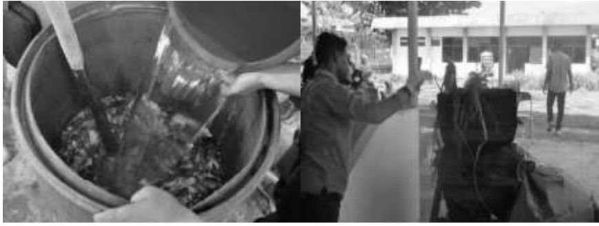
Gambar 5. Proses Pembuatan Kompos

Selanjutnya kegiatan pelatihan “Pengolahan Nanas dan Hortikultura” ( Gambar 6 ) bertujuan untuk memberikan pengetahuan kepada kelompok masyarakat dalam memanfaatkan SDA yang ada di sekitar mereka untuk selanjutnya dilakukan ke tahap pengembangan produk yang layak dipasarkan. Tujuan yang sama seperti kegiatan sebelumnya, namun dengan sumber daya yang berbeda pula. Berlimpahnya tanaman hortikultura yang menjadikan mayoritas masyarakat juga memiliki mata pencaharian sebagai petani hortikultura juga menjadikan suatu keuntungan dalam kegiatan pemberdayaan masyarakat ini.