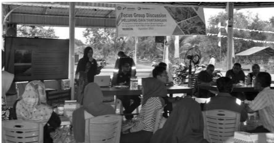
Gambar 2. Pemaparan Materi Focus Group Discussion

Identifikasi masalah , yang di mana tim melaksanakan Survei lokasi, analisis karakteristik maupun masalah yang dihadapi di wilayah pengabdian, serta diskusi bersama mitra. Keberlanjutan dari kegiatan tersebut, maka disimpulkan untuk dilakukan Focus Group Discussion bertajuk “Peluang dan Tantangan Pertanian Holtikultura pada Lahan Gambut di kecamatan Bukit Batu, Kabupaten Bengkalis” yang dapat dilihat pada Gambar 2 .