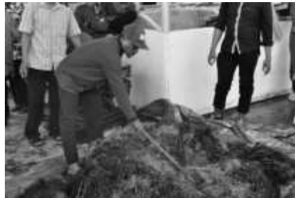
Gambar 8. Hasil Pengolahan Pupuk Organik Padat

Sedangkan produk yang dihasilkan dari kegiatan pelatihan “Olahan Nanas dan Hortikultura” ialah Pineapple Cookies ( Gambar 9 ) dan stik kangkung ( Gambar 10 ). Produk-produk tersebut selanjutnya dapat dikembangkan kepada tahap promosi produk hingga pemasaran. Namun, terkhusus untuk produk pupuk kompos, dapat dipergunakan untuk kebutuhan sehari-hari petani setempat tetapi tidak menutup kemungkinan untuk dipasarkan juga jika ada pengemasan yang memungkinkan.