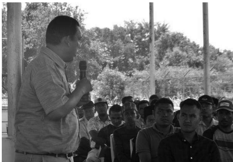
Gambar 4. Pemaparan Materi Pembuatan Kompos

Pengambilan solusi , pada tahap ini tim memutuskan untuk melaksanakan kegiatan lanjutan demi merespon permasalahan-permasalahan yang didapat pada FGD sebelumnya. Kegiatan lanjutan tersebut ialah diadakannya pelatihan “Pembuatan Pupuk Kompos” beserta pelatihan “pengolahan nanas dan hortikultura”. Kegiatan pelatihan “Pembuatan Pupuk Kompos” ( Gambar 4. ) bertujuan untuk memberikan pengetahuan kepada kelompok masyarakat dalam pemanfaatan limbah tanaman sekitar yang terbuang yang berada di sekitar mereka untuk selanjutnya dilakukan ke tahap pengembangan produk yang layak disebarluaskan. Mengingat keberagaman sumber daya hayati seperti tumbuh-tumbuhan yang ada di Kecamatan Bukit Batu beraneka ragam dalam pemanfaatannya, baik untuk makanan, obat-obatan, maupun dijual secara mentah, tentu saja sebuah keharusan untuk menjaga dan melestarikannya melalui macam-macam cara seperti menggunakan pupuk. Kegiatan ini berkerja sama dengan BUMDes setempat beserta beberapa kelompok masyarakat yang memiliki peranan penting dalam pengaplikasian hasil pelatihan ini nantinya. Berbagai tahapan praktik pembuatan kompos dilakukan dapat dilihat pada Gambar 5.