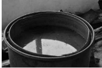
Gambar 7. Hasil Pengolahan Pupuk Organik Cair