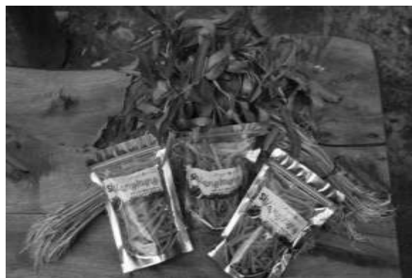
Gambar 10. Hasil Produk Olahan Kangkung