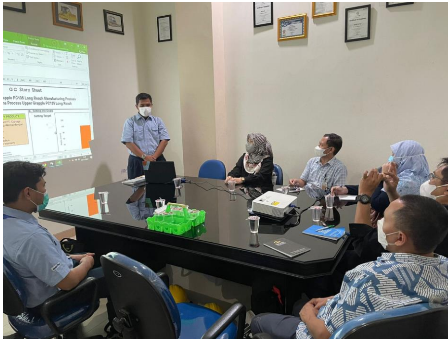
Gambar 1 Pembukaan sekaligus sambutan oleh ketua tim