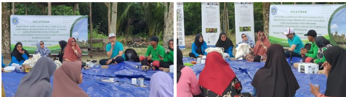
Gambar 6 Suasana ketika Melakukan Peningkatan Skill Komunikasi Pemasaran

Konsep-konsep tersebut dipaparkan kepada mitra (MBL Conservation) dan masyarakat produktif sekitar yang terlibat saat itu dalam pelatihan. Seluruh peserta pelatihan menyimak dengan baik penyampaian materi. Di samping penyampaian materi, tim PKM dan peserta melakukan beberapa demonstrasi pelaksanaan komunikasi pemasaran secara lisan. Setiap demonstrasi yang dilakukan oleh peserta ditanggapi secara bersama kemudian diberikan umpan balik secara positif kepada mereka sehingga mereka lambat laun memperoleh skill dalam komunikasi pemasaran. Gambar 6 berikut merupakan suasana ketika dilakukan peningkatan skill komunikasi pemasaran saat pelatihan berlangsung.