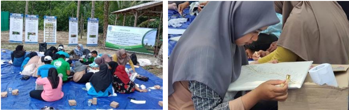
Gambar 4. Proses Membatik oleh Peserta

berwarna putih. Kain ini berupa tas totebag yang bisa digunakan langsung oleh wisatawan sebagai merchandise . Gambar 4 berikut memperlihatkan proses pelatihan membatik yang diikuti oleh tim MBL Conservation dan masyarakat sekitar yang ikut dilibatkan.