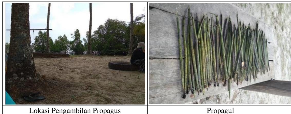
Gambar 1. Lokasi Pengambilan Sampel dan Propagus Rhizophora Sp.

Mangrove yang berada di sekitar lokasi mitra (MBL Conservation) berada di desa Sebong Perih, Kecamatan Teluk Sebong, Kabupaten Bintan, Provinsi Kepulauan Riau. Identifikasi bahan alami berupa buah mangrove, khususnya propagul diambil di sekitar sepanjang Pantai Teluk Sebong. Propagul yang diambil dengan kategori yang sudah tua, jatuh, dan sudah kering. Propagul dipotong kecil lalu dikering dan anginkan selama lebih kurang 7 hari.