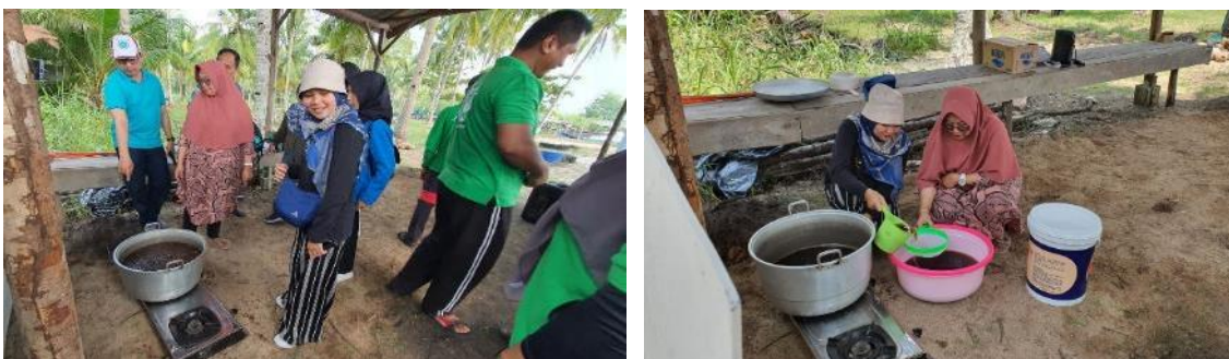
Gambar 3. Pelatihan Awal Pembuatan Ekstrak Tannin dari Propagul Mangrove

Tannin merupakan metabolit sekunder yang ada pada tanaman mangrove (Hernes et al., 2001; Shah, 2021; Wen et al., 2020). Setelah tahap pertama selesai, propagul yang telah dikumpulkan itu lalu dikeringkan selama 2 minggu. Kemudian propagul dihaluskan dan siap digunakan sebagai bahan ekstraksi. Pembuatan ekstrak tannin dilakukan dengan menambahkan potongan propagul yang sudah kering ke dalam 10 liter air mendidih. Proses ekstraksi berlangsung selama lebih kurang 2 jam untuk mendapatkan ekstrak pekat. Biarkan mendidih sampai air berkurang 30% dari rebusan awal. Selanjutnya, proses ekstraksi dilanjutkan dengan filtrasi yang bertujuan memisahkan ekstrak pekat dengan residu propagul. Didinginkan dan siap untuk dilakukan pencelupan bahan kain.