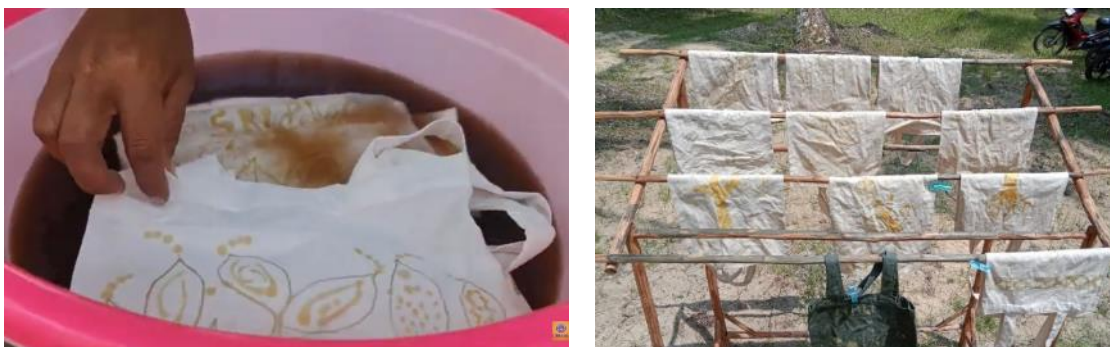
Gambar 5. Kain Totebag sedang Dijemur Setelah Dichelupkan Bahan Fiksator Beberapa Kali

Proses membatik tersebut diikuti dengan rasa senang oleh setiap peserta. Mereka sangat antusias menghasilkan motif-motif batik yang seusia dengan kreasi mereka masing-masing. Tindak lanjut dari kreasi tersebut, rencananya akan dipatenkan menjadi hak milik dari MBL Conservation sendiri. Selain proses pembuatan motif batik, peserta juga dilatih melakukan proses membatik menggunakan canting bersama malam (lilin) yang disiapkan secara khusus. Mereka cukup telaten mengikuti alur motif batik yang telah dilukis sebelum menggunakan canting tersebut. Setelah selesai, semua kain batik yang telah diberi malam itu, kemudian direndam ke dalam zat warna alami yang diambil menggunakan propagul mangrove. Setelah beberapa menit dilakukan perendaman, kain totebag tersebut dijemur di bawah sinar matahari untuk mendapatkan warna yang lebih natural seperti pada gambar 5 berikut.