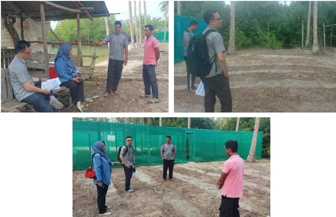
Gambar 2. Diksusi Pemilihan Lokasi Pembangunan Pondok Batik Griya Mangrove dan Rencana Lokasi Pembangunan Pondok Griya Batik Mangrove